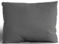
70x55 ボルスター W 700/D 400/H 550 ¥33,000